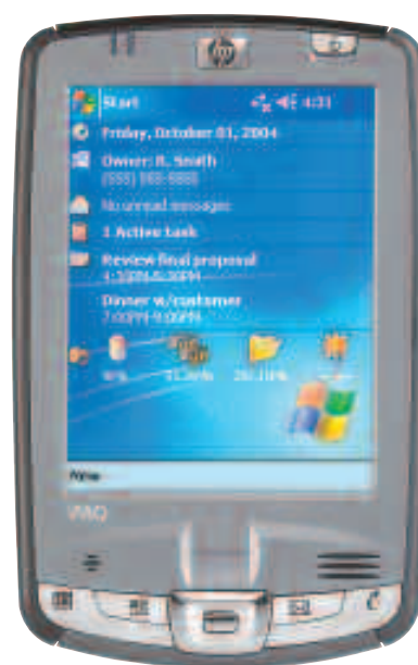
HP iPAQ serie hx2000

Nuestra versátil familia de handhelds HP iPAQ serie hx2000 te ofrece excelentes configuraciones de alto rendimiento y seguridad optimizada, para adaptarse a tus necesidades móviles de negocio y personales.