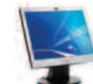
Pantalla plana de 19" HP L1906 N/P: PX850AA