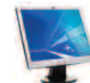
Pantalla plana de 15" HP L1506 N/P: PX848AA

Además de permitirte visualizar tus aplicaciones con mayor claridad y nitidez, los monitores de pantalla plana HP te ahorran espacio en el escritorio.