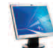
Pantalla plana de 17" HP L1706 N/P: PX849AA